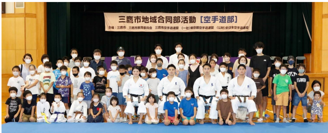
参加者と演武者 第2会場(三鷹2中)