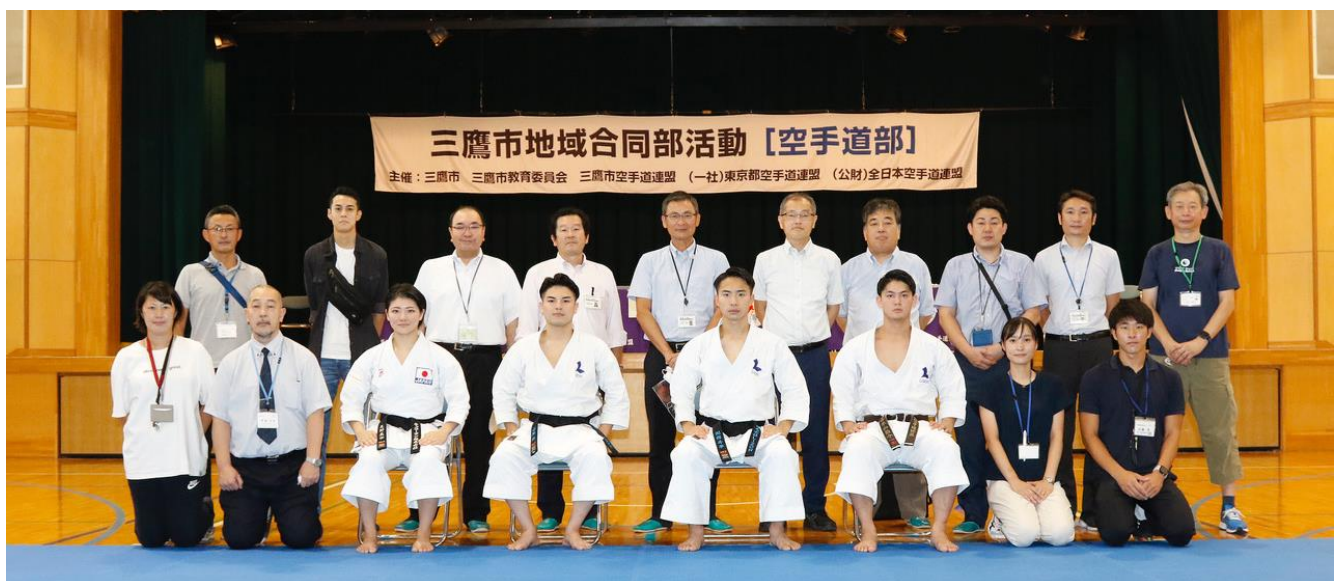
三鷹市教育委員会と中学校関係者 第2会場(三鷹2中)