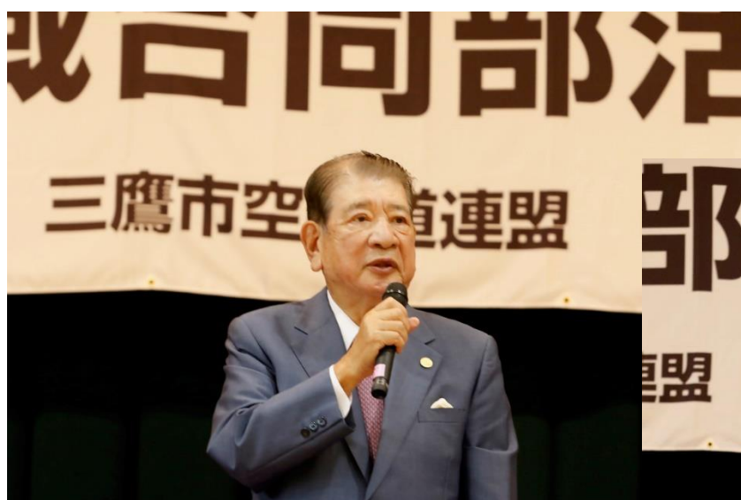
公益財団法人全日本空手道連盟 会長 笹川 堯