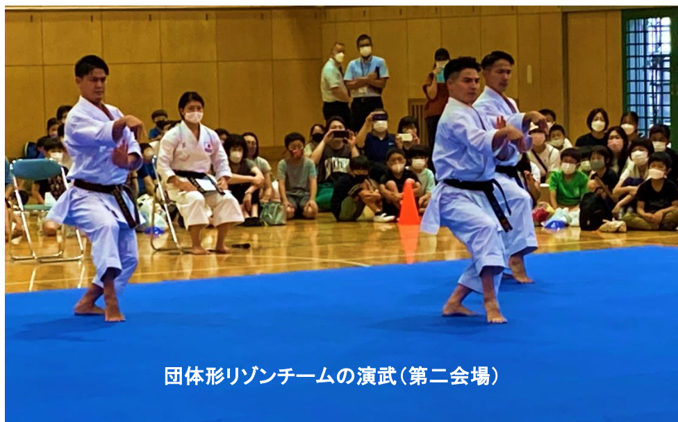
団体形リゾンチームの演武(第二会場)