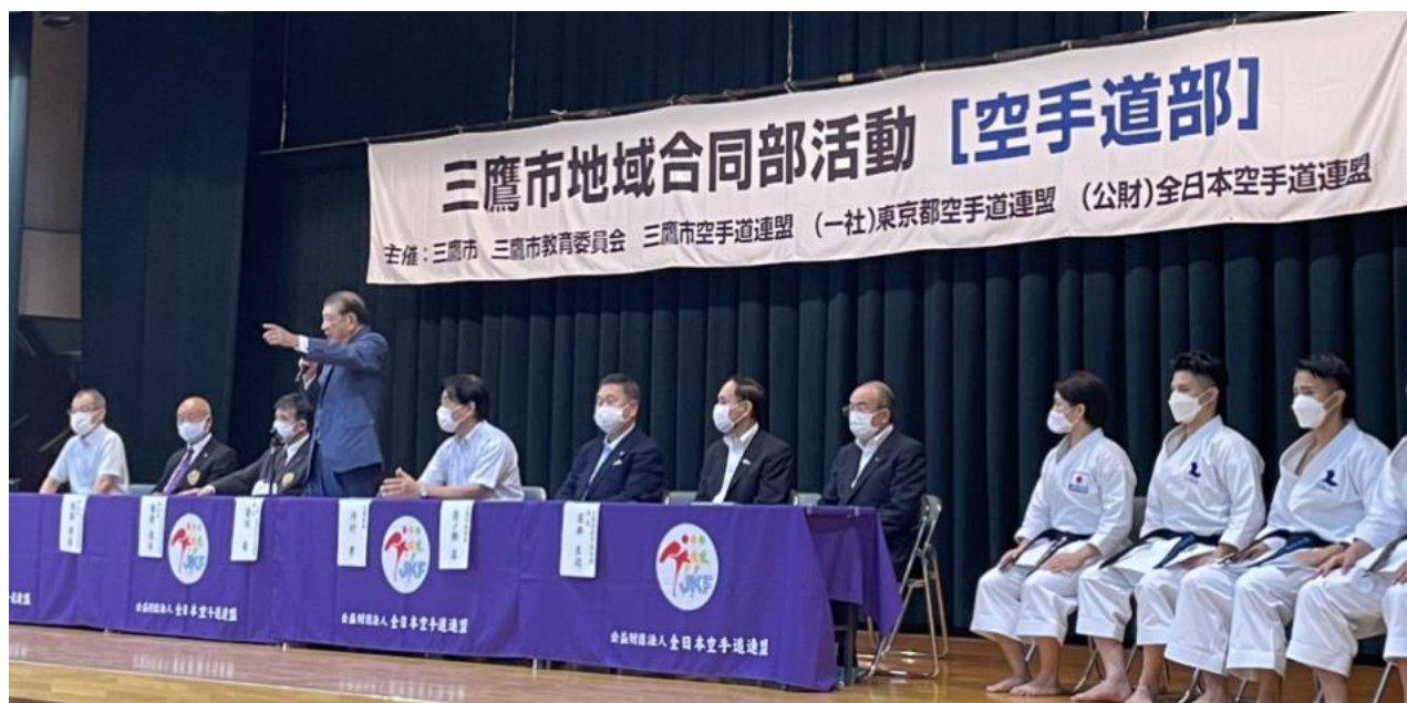
開会式 第2会場(三鷹2中)