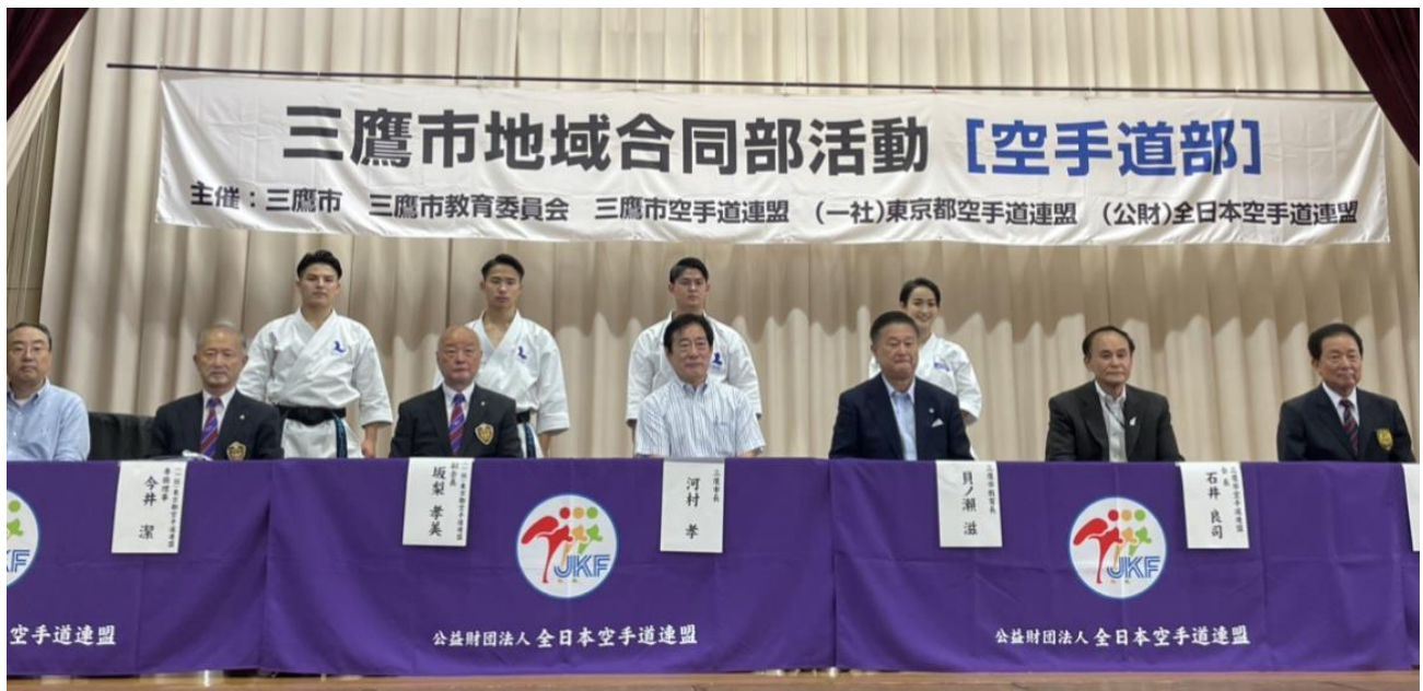
来賓と演武者 第一会場(三鷹6中)